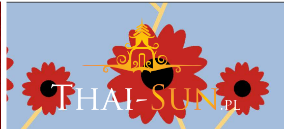
UŻYCIE NIEPRAWIDŁOWEGO TŁA