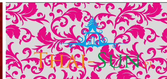
STOSOWANIE BARW NIEZGODNYCH Z USTALONĄ LINIĄ KOLORYSTYCZNĄ