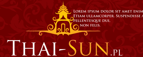
BRAK POLA OCHRONNEGO