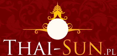
DODAWANIE OBCYCH FORM DO ZNAKU