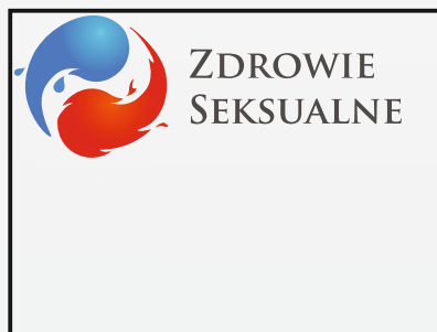
UMIESZCZANIE ZNAKU ZBYT BLISKO KRAWĘDZI STRONY