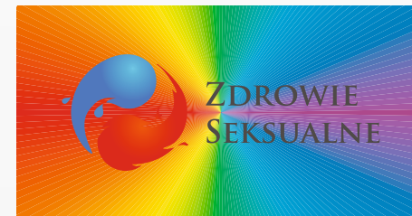
UMIESZCZANIE ZNAKU NA AGRESYWNYM TLE